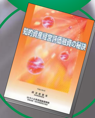
手引書『知的資産経営評価融資の秘訣』を進呈します

地域密着型金融の担い手(=資金の貸し手) はもとより、知的資産を活かして事業を 成長させたい企業(=資金の借り手)も必見です。