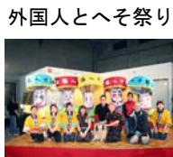
外国人とへそ祭り