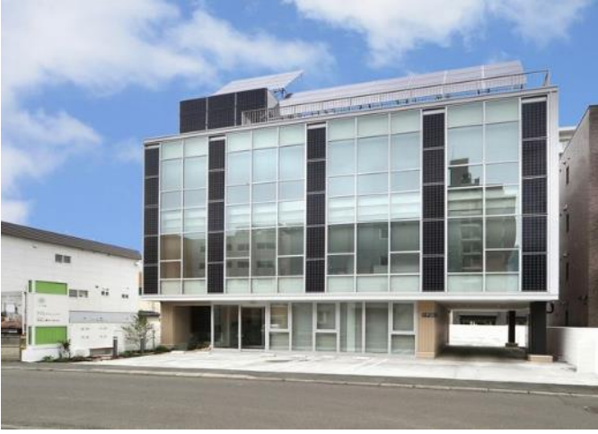
アリガプランニング新社屋