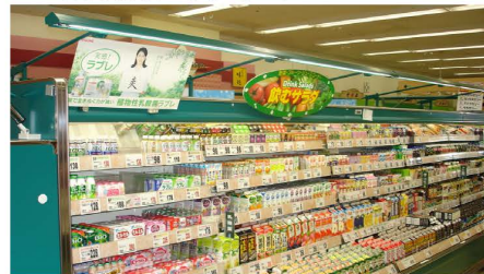
▲アップライト型照明。棚板ごとの照明を外し、蛍光灯による冷凍機への負荷も減少。