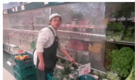
▲ナイトカバーの徹底により冷気の漏れを防止