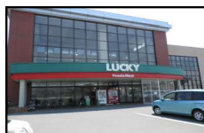
ラッキー花川南店