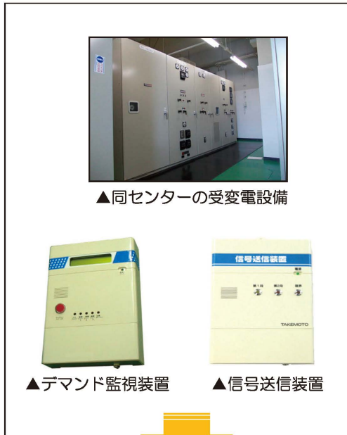
▲同センターの受変電設備