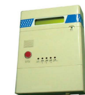
▲デマンド監視装置