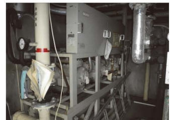
▲警報発生時に自動停止する冷凍機