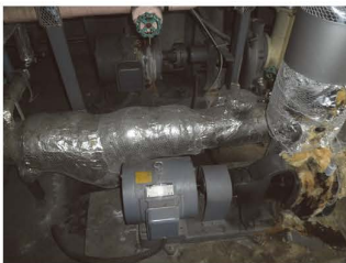
▲インバータ制御とした冷温水ポンプと冷却水ポンプ