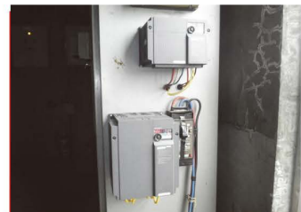
▲新たに設置した2台のインバータ