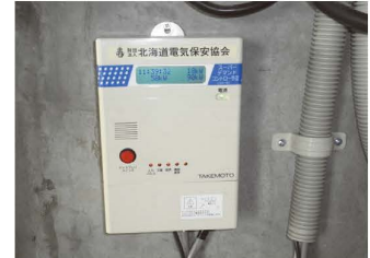
▲デマンド監視装置