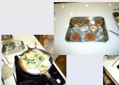
余熱や食材の効能を有効活用した料理