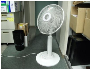
サーキュレーター(扇風機)