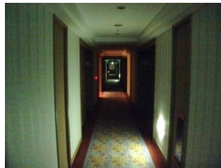
フロアクローズ時の様子