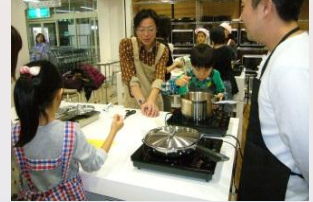
参加者の料理風景