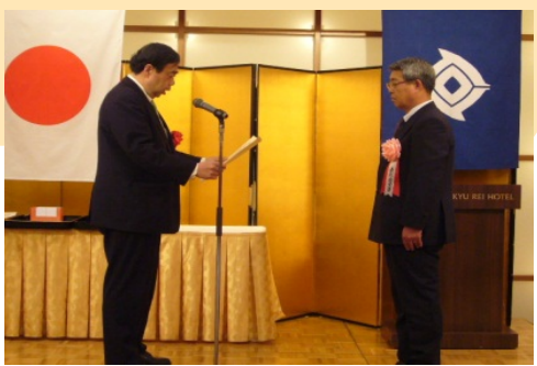
<担当：資源・燃料課>

本表彰は、道路、橋梁、港湾などの整備等に必要不可欠な骨材等を供給する採石業の健全な発展を図ることを目的として、平成10年度から実施しており、特に優れた採石事業所及び業務管理者(個人)を対象としています。