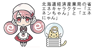
北海道経済産業局の省エネキャラクター「エネちゃん」と「エネにゃん」

特に、6月から9月までの夏季の省エネキャンペーンの期間のうち、 節電協力要請期間である7月から9月を「節電・省エネ集中実施月間」とし 、省エネルギー・節電の普及活動を行い、省エネルギー・節電対策の実践についての協力をお願いしております。