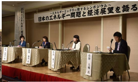
【パネルディスカッション】