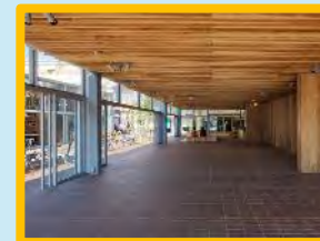
多目的利用スペース