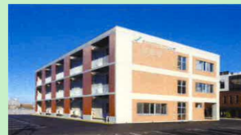
北大ビジネススプリング

販路開拓 ・展示商談会 ・eコマース 海外展開 ・J-GoodTech ・海外現地調査等の支援 ・セミナー、他