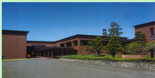
中小企業大学校 旭川校