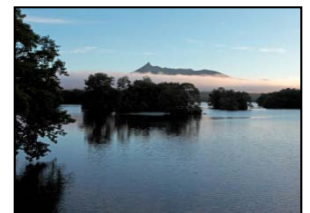
【地域産業資源】 大沼国定公園