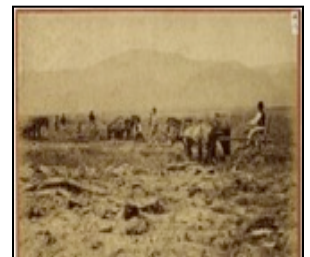
【地域産業資源】 七重官園の様子

また、プロモーションについては、七飯町、七飯町商工会及び七飯大沼国際コンベンション協会からの事業推進に係る支援を受けるとともに、近隣自治体の関係機関や都市部の専門家などと連携を図り、道南エリアのブランド化を図る。