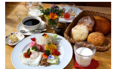
地域産品にこだわった 食事メニュー

釧路湿原へ観光に訪れる観光客に併せ、旅行エージェント各社と連携、周辺自治体や関係機関とのタイアップによるプロモーションを展開するとともに、SNS等の活用によるPRを実施する。