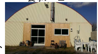
D型ハウスを改装した 宿泊施設

同地における観光は、従来景観を中心としたものである中、地域の資源を食や体験を通じ提供するの初取り組みであり、優位性がある。