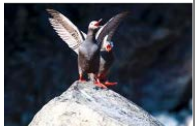
ケイマフリの求愛行動