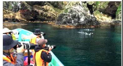
ボートウォッチング