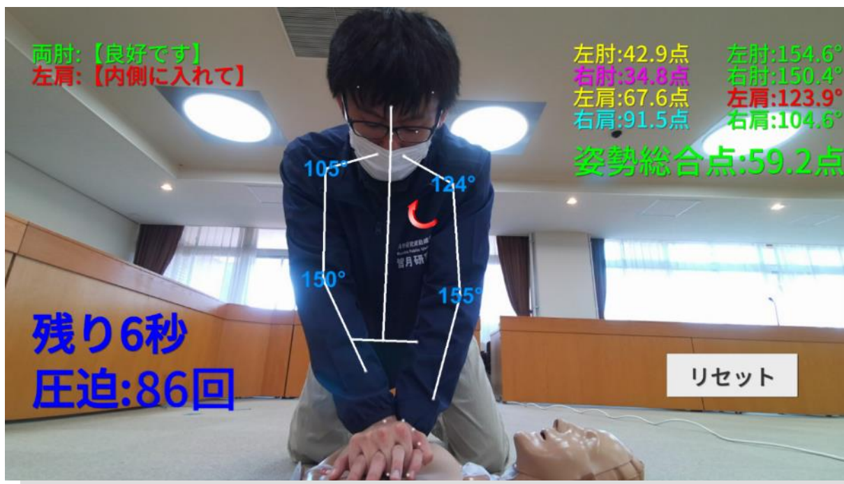
▲Azure Kinectによる正面カメラのインターフェース

CyberBiomechanicsは、 システムによる正しい心肺蘇生法の普及とシステムを設置・操作するオペレーターの認定資格者を育成します