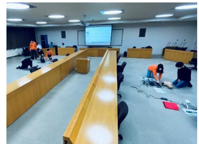
▲オペレーターの認定資格制度を目指した「CPR訓練リレー」の様子