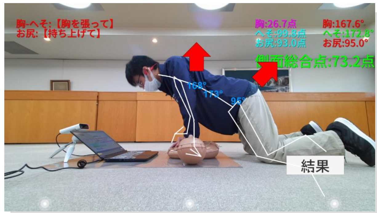
▲Azure Kinectによる側面カメラのインターフェース