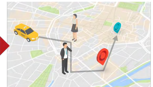
3. リアルタイムにルート最適化