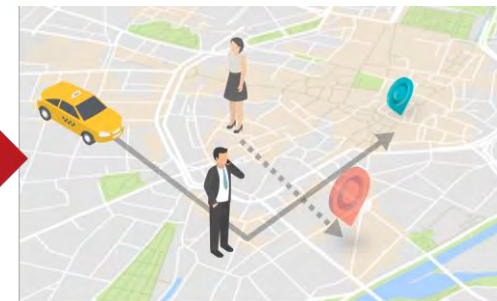
2. 異なるデマンドが発生