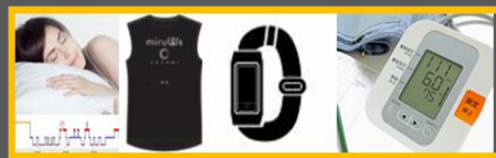
多様なバイタルサインセンサ/健康測定器(血圧計等)