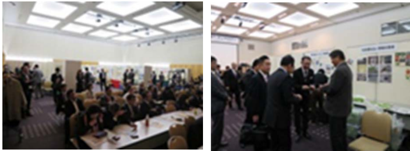
医療機関等とバイオ企業のマッチングセミナー(平成27年3月20日)