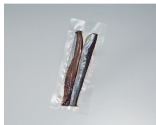
余市流 鱈の肴 ～にしんジャーキー～一本羽 有限会社マルコウ福原伸幸商店 (余市町)