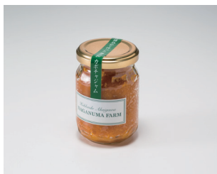
カボチャジャム 株式会社永沼農園 (赤井川村)