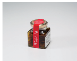
ドライミニトマトの オリーブオイル漬け 鳥羽農園 (南富良野町)