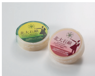
北大石鯨 (ピュアフコイダン) / 北大石鯨 (マリングリーン&フコイダン) 北海道マリンイノベーション株式会社 (函館市)