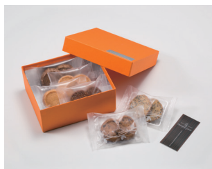
オリジナルクッキーアソート パティスリー ショコラティエ シュウェットカカオ (函館市)