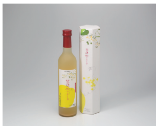
菩提樹のはちみつミード/ 菩提樹のはちみつスイートミード 株式会社菅野養蜂場 (訓子府町)