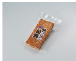
角焼 (かくやき) カネタ吉田蒲鉾店 (岩内町)