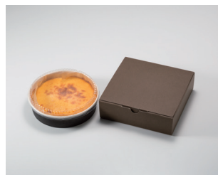
男爵チーズケーキ パティスリー ジョリ・クレール (北斗市)