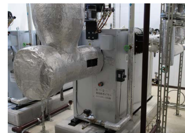
省エネジャケット