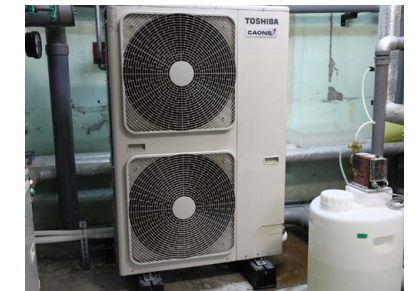
空気熱源ヒートポンプ

空気熱源ヒートポンプは、大型施設にあるボイラー室などから25℃前後の排熱を回収できます。また、空水冷熱源ヒートポンプシステムは全国的にも設置例が少なく、これまで温泉の熱源を活用できないと考えていた冷泉のホテル等でも熱回収システムとして期待できます。