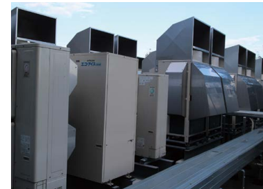
空水冷熱源ヒートポンプ(室外ユニット)

冷房や機械室から出る排熱を回収し冷泉の加温をするため、道内で初めて空水冷熱源ヒートポンプと空気熱源ヒートポンプを導入しました。また、ボイラー関連設備の熱の放散を防ぐため、蒸気ヘッダー裸弁に省エネジャケットによる断熱工事も実施しました。