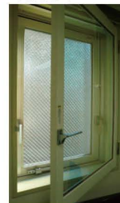
▲複層Low-Eガラス内窓サッシ