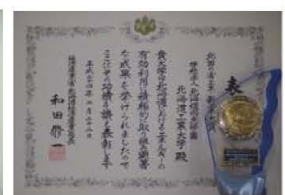
▲北国の省エネ・新エネ大賞受賞