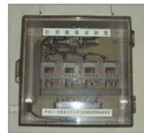
▲電力量計測器収納盤