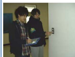
▲校内パトロールの様子