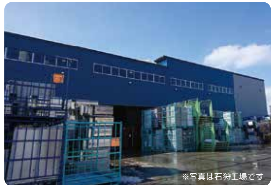
※写真は石狩工場です

道内に3カ所ある家電リサイクルプラント(工場)の2つ。捨てる時に皆さんにリサイクル料金を負担いただいている4種類の家電(*)のうち、石狩リサイクル工場では冷蔵庫・洗濯機・エアコンの3種類、発寒リサイクル工場ではテレビを手で分解したり機械で砕いたりしながら、鉄やアルミや銅、ガラスやプラスチックなどの資源を選別して回収しています。