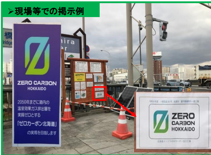
＞現場等での掲示例