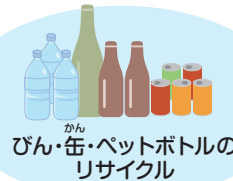
びん・缶・ペットボトルの リサイクル