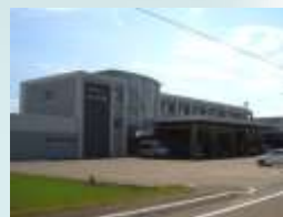
養護老人ホーム「和風園」