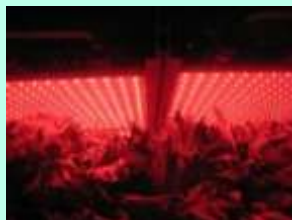
▲660ナノメートルの赤色LED照明

これにより、消費電力量を削減するとともに、点灯時の室内への発熱を抑制し、工場内の湿気による機器腐食防止にも貢献。