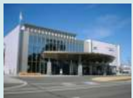
生涯学習総合センター「ゆめっくる」