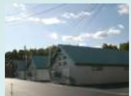
就農支援実習農場 椎茸発生棟