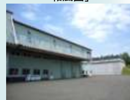
予冷库併設製氷設備