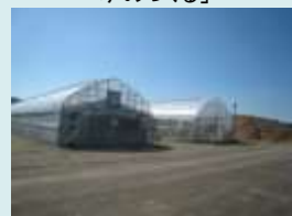
就農支援実習農場 イチゴ栽培施設