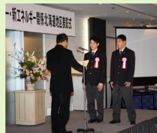
北海道岩見沢農業高等学校