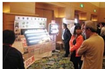
＜昨年度の開催の様子＞