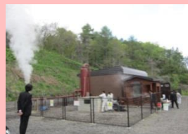
洞爺湖温泉利用協同組合 地熱発電設備