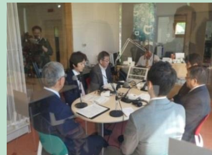
「ラジオニセコ」記念放送の様子

平成29年7月29日（土）～30日（日）に開催された本イベントから排出されたCO 2 （会場の電気使用量など）2トン北海道内産のJ-クレジットを活用しカーボン・オフセットしました。