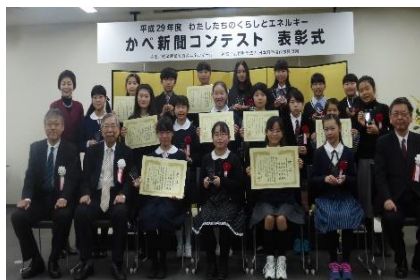
3月4日（日）、日本科学未来館（東京都）で行われた表彰式の様子

※コンテスト全体の実施結果や受賞作品一覧等については、以下のURLをご覧ください。