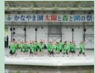
第46回かなやま湖湖水まつり