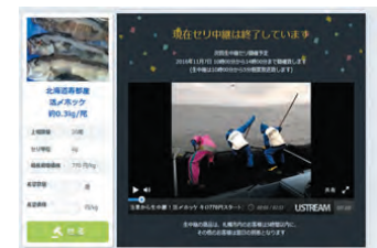
オンラインでの取引

現在、台湾、タイ、シンガポールへ生鮮品等を出荷。今後は現地企業とアライアンスを組み、競りの実況中継や海外とのオンラインでの取引、動画を活用したトレーサビリティの強化を進める計画。また、地域資源やコンテンツが豊富な北海道の産品を ASEAN をはじめ世界へ広く販売するため、海外現地でのゲートウェイカンパニーの設立を目指している。