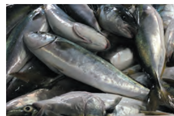
産地の新鮮な食材

全国 600 の生産者や産地を中心とした仕入先から 3,000 種以上の生鮮品や冷凍商材を仕入れ、卸売業務による販売とインターネット上の仮想市場での販売を通じ、全国 10,000 店舗の飲食店等へ産地直送品を超速かつ安価に提供。産地から 5 時間での配送や高鮮度商品の出荷対応により顧客からの信頼を獲得。ウェブサイトでは、単価や発注単位等の他、食材にあった調理方法等の情報を提供し、受発注や請求書管理システムの利用や、注文した原料の加工依頼も無料で行うなど、顧客満足度の高いサービスを提供。