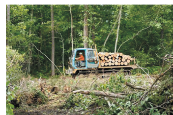
地域広葉樹資源活用へのこだわり

同社のオリジナル合板である「ペーパーウッド」に用いられているのは、シナの木とシラカバの間伐材であり、北海道の恵まれた広葉樹資源を活用している。地元森林資源を活用することにより、林業活性化のみならず、森林のメンテナンスに繋がり、森林の保水力を維持するなど、地元の森林環境保全にも貢献している。また、クラフト製品の製造は、地元家具メーカー、クラフト工芸メーカーと連携するなど、地域の木材加工産業全体の活性化、高付加価値化に寄与している。