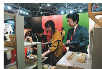
海外展示会への積極的な出展

日本の合板は、海外との価格競争等により販売数が激減しているが、品質や精度の面では世界をリードしている。創業80年超の同社は、日本の技術力の高さを世界にアピールしたいという思いから、品質を維持しつつデザイン性も兼ね備えた、自分達にしかできないオンリーワン製品として「ペーパーウッド」を開発。海外展開にあたっては、著名美術館のミュージアムショップを当面のメインターゲットとし、製品の認知度や信用力を高めることで、今後幅広い販路開拓を図る戦略をとっている。