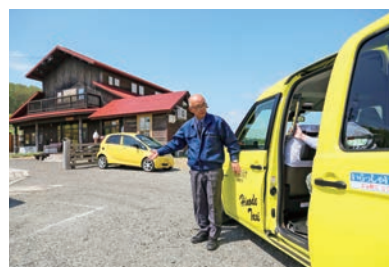
接客中のドライバー

岩見沢市観光協会では「やさしい日本語ツーリズム」を推進しており、同社のドライバーがインバウンドの出身国の文化や慣習を学ぶセミナーへ積極的に参加。異文化を理解することで、外国語が話せないドライバーの「苦手意識」を解決し、「ジェスチャーや、やさしい日本語で対応します」と4カ国語で書かれたカードを乗客に提示するなど、おもてなしの「心」を伝えつつ、ニーズに合わせたサービスを提供する等地域全体で目指しているインバウンド需要獲得に向けた取組を実施。