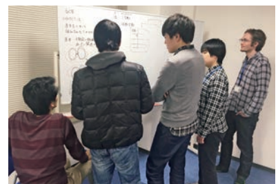
議論もコミュニケーションの場

フレックスタイム制で、個人の事情に応じた柔軟な働き方を推奨。また、チーム制で業務を進めることにより風通しの良い職場環境を構築し、職場内チャットを用いたコミュニケーションを活用しながら業務を進めることにより、社員がそれぞれの立場で業務への貢献を感じられるような経営を行っている。半年に一度、上司との打合せを通じて定期的に業務の進捗を確認。それにより、双方向の理解が高まり社員のモチベーション向上に繋がっている。