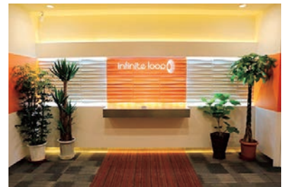
札幌本社エントランス

年齢・性別・学歴・国籍不問で社員を積極的に採用している。また、北海道へのU・Iターン採用を積極的に実施し、将来、独立を考えているエンジニアを歓迎。年齢や役職を排除して実力で勝負できるフラットな組織作りを常に意識している。また、実力・成果重視としながらも周囲の社員からの評価を反映する相互評価制度を採用して公平性にも配慮。雇用環境改善や働きやすい職場作りでも多くの取組を行っている。加えて無料の社内自動販売機、年4回の食事会、部活動等、福利厚生も充実させ、社内のコミュニケーションを円滑にしている。