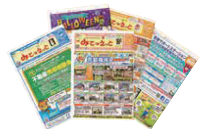
地元生活情報誌「みてネット」

地元情報誌『みてネット』は、「地域密着型の企業広告媒体」として地域での認知度は高く、またポスティングで配布するという同社独自の手段から、普段新聞を読まない世代にも読まれている冊子である。同誌に自社の広告を載せたいという企業は絶えない状況にあり、地域で「創業」した企業も、まずは『みてネット』で広告を出して販促を進めるといったサイクルができあがっている。同社は、この商材を通じて新たなニーズを発掘し受注の取込みを図る等、需要獲得に結びつけている。