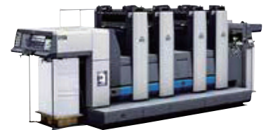
A全判高速オフセットカラー印刷機

高齢化社会を迎える日本では、高齢者への配慮はもちろん、障害者や子供、外国人への配慮も求められている。同社は、さまざまな用途に柔軟に対応可能な印刷機やプリンターを有し、「デザイン」「文字の使い方」「色の使い方」等にさまざまな配慮や工夫を加えることで、見やすいメディアの提供を可能とし、利用者が必要とする情報をわかり易く伝えることを心掛けている。設備としては、最新鋭のオフセット印刷機を導入し、5,000部から1万部以上の大ロット印刷にも迅速かつ高品質で対応できる技術を有している。