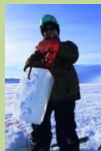
ファシリテーター