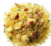
サラダにかけるお米パフ(イメージ)

また、段階的に委託製造から自社製造へと自社工場を整備し、製造コストの削減を目指すとともに、「農家と米穀店」の共同ブランドイメージを構築し、商品の付加価値を高め販売・販路開拓を行う。