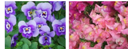
エディブルフラワー [ピオラ(左)、金魚草(右)]

岩見沢市観光協会と連携し、地域の観光・ホテル・菓子業界等への活用を通じて認知度向上を図り、道内外へのプロモーション展開を行う。