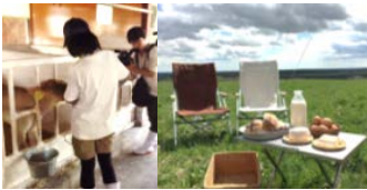
酪農体験とチーズ作り体験

(有)竹下牧場と(株)山川は、(一社)北海道中小企業家同友会がきっかけで知り合い、観光関連の事業等で協力関係にあった。最近の酪農体験やアクティビティ等のサービスへの高まりや、増え続ける空き家管理の問題等、本事業の実施より、両者の強みを活かした都市農村交流サービスの具体化に向け連携に至った。