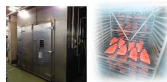
スモークマシン外観(左図)、内部(右図)

厚岸漁業協同組合が供給するカキ、イカ、イワシなどの海産物を、丸高水産(株)がスモーク加工し、製品化。スモークは、丸高水産(株)特注のスモークマシンを用いて、北海道産の広葉樹チップにより、熟成庫において素材の状態を確認しながら温度、時間、煙の量を調整して低温燻製を実施。また、スモークした海産物を用いて、マリネ等の2次製品を製造。販売は、両者が有する販路を活用し、共同して実施。