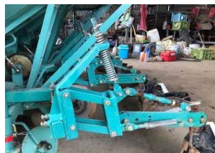
培土ブラケット(現製品)

(有)サンヨー工業は、平成23年頃から地元じゃがいも生産者のニーズに応えるため、じゃがいもの播種と同時に、培土を行う作業機のアタッチメントの開発に取り組み、「培土ブラケット」を開発した。当該製品を使用した生産現場では、省力化につながったなどの好評価を得ている一方で、「石や土塊が含まれている土地」、「傾斜地」における使用環境では、播種と培土の位置関係に誤差が生じる等の新たな課題が浮き彫りになった。本事業では、多様な土壌に対応できる新構造で耐久性の向上を図った新型「石対策培土取付ブラケット」を開発し、規模拡大や労働力確保などの課題を抱える生産現場の省力化を目指す。