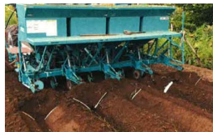
培土機による土寄せ状況

平成29年1月に北海道経済産業局と北海道農政事務所の共催で開催した「6次産業化・農商工連携フォーラム」に(株)希来里ファームが参加した際、農商工連携制度を活用した農業機械の開発事例を知ったことが契機。その後、取引関係にある(株)希来里ファームと(有)サンヨー工業が相互の課題を共有し、課題解決を目指した新製品を開発するに至った。