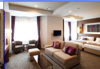
資料: (株)登別グランドホテル作成