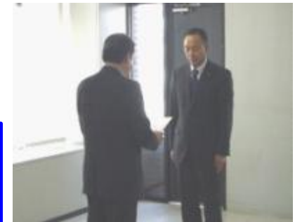
ヤマトグループ選定通知書授与 (H24.4)